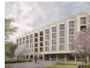
Seniorenzentrum in Winterthur (ZH)