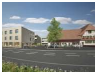
Seniorenzentrum in Orpund (BE)