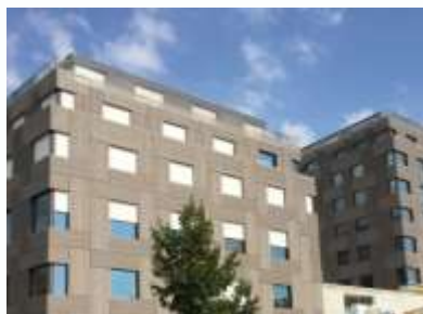
Patientenhotel in Lausanne (VD)