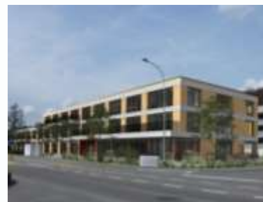
Pflegezentrum in Obersiggenthal (AG)