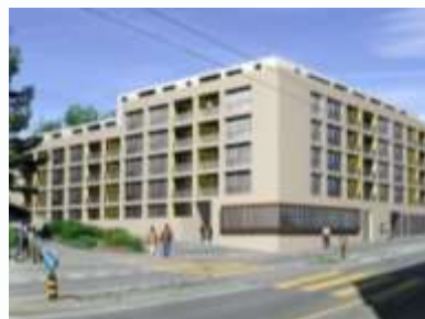
Seniorenzentrum in Emmenbrücke (LU)